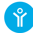
MIJN GEVOELENS EN GEDACHTEN