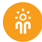
LEKKER IN JE VEL ZITTEN