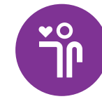
NU EN LATER